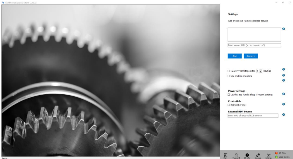
Figur 1 Klienten er installert

Når programmet er installert så får du opp dette bilde